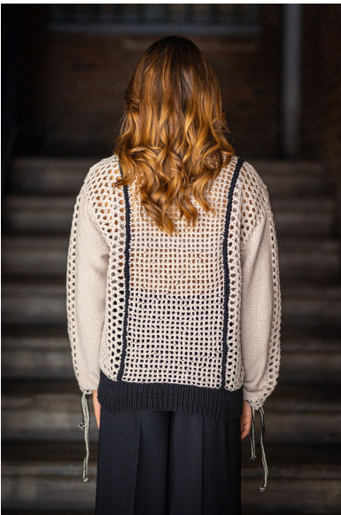
Schema 1: Puntito rete-blei