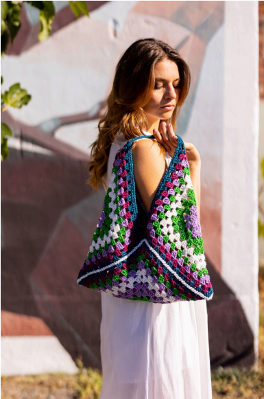
Schema 1: motivo granny