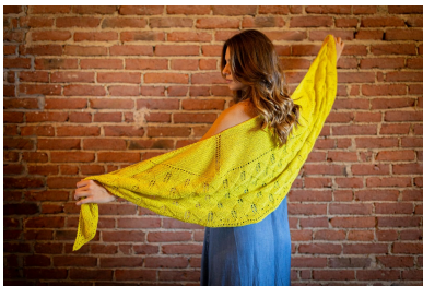
Punto lume di candela