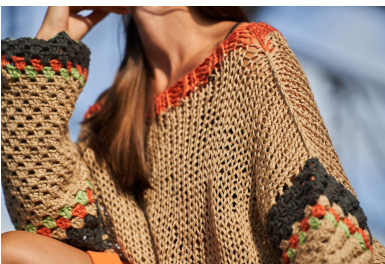
Schema: inizio della manica (lavorazione granny)