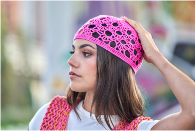
Punto fantasia traforato