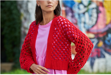
PANNELLO PRINCIPALE DEL CARDIGAN