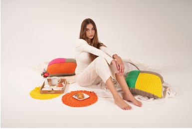
Schema 1: pannello corda a punto archetti sfalsati